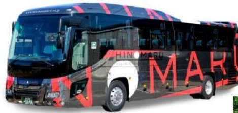
▲今回も豪華バスでGO!!