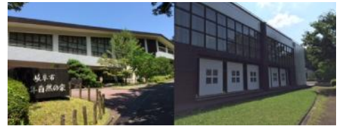
▲仲間と一緒に少年自然の家に泊まります☆

※いつもご飯が出てくるのが当たり前、朝起こしてもらるのが当たり前。本当にそうかな？身の回りのことは全て子供自身で行うことで、ありがたさを実感できるように導きます。