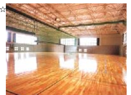
▲雨天時の為に体育館も2日間貸切済み☆