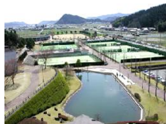
▲2日間テニスコート4面貸し切りでたくさん練習＆シングルス・ダブルス大会します☆