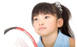
▲合計8時間以上のテニス漬け合宿！