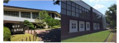
▲仲間と一緒に少年自然の家に泊まります☆

※いつもご飯が出てくるのが当たり前、朝起こしてもらうのが当たり前。本当にそうかな？身の回りのことは全て子供自身で行うことで、ありがたさを実感できるように導きます。