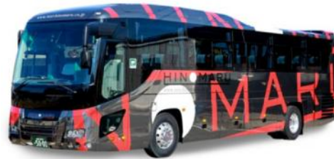
▲今回も豪華バスでGO！！