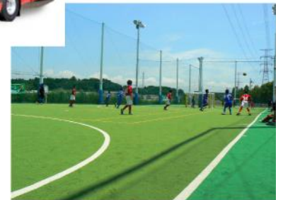
▲広々とした屋外でのびのびプレー！コートは2日間貸切！