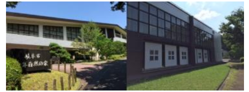
▲仲間と一緒に少年自然の家に泊まります☆

※いつもご飯が出てくるのが当たり前、朝起こしてもらうのが当たり前。本当にそうかな？身の回りのことは全て子供自身で行うことで、ありがたさを実感できるように導きます。