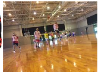
▲広々とした体育館でのびのびプレー♪ 体育館は2日間貸切！